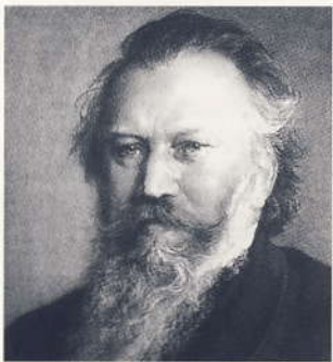
Oberschwäbische Elektrizitätswerke (OEW)

Johannes Brahms verbrachte die Sommer der Jahre 1886 bis 1888 in der Schweiz, in Hofstetten am Thuner See. Während seines ersten Aufenthaltes dort schrieb er die Werke mit den Opuszahlen 99 bis 102: die Cellosonate, seine zweite Violinsonate, das c-Moll-Klaviertrio und das Doppelkonzert für Violine und Violoncello. Alle diese Werke atmen den Geist der Urlaubsatmosphäre: der See, mit Sicht auf die Berge. Die Kammermusikwerke wurden noch im selben Jahr uraufgeführt. Das Konzert mit dem Beethoven Trio bringt diese Kompositionen in der Reihenfolge der Entstehung und der Uraufführung zu Gehör. Der Ort passt: Schloss, mit Sicht auf Bodensee und Berge.