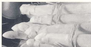
H.+H. Gerätebau GmbH

Beim traditionellen Spargelfest steht natürlich, wie immer, der Tettninger Spargel auf der Speisekarte. Es soll aber in diesem Jahr nicht bei dem einen Produkt der Tettninger Landschaft bleiben: Auch Beeren und Obst stehen auf der Speisekarte und als Getränk bietet sich unter anderem ein Tettninger-Hopfen-Produkt an. Für Begleitmusik zu diesem regionalen Menü ist wie jedes Jahr gesorgt.