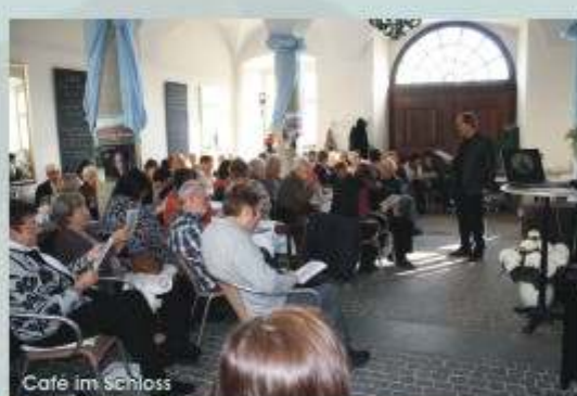
Bodensee Medienzentrum, Tett nang Regionalwerk Bodensee, Tett nang

Eintritt 8 €, inkl. Begrüßungssekt freie Platzwahl