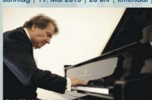
Rudolf Buchbinder

Sonntag | 19. Mai 2013 | 20 Uhr | Rittersaal | Barockschloss